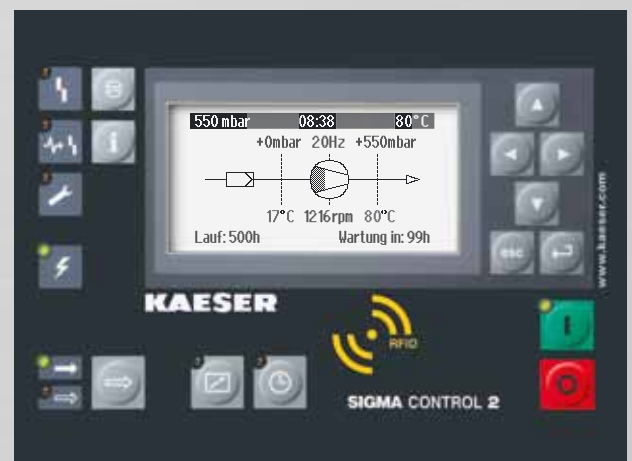
Abb.: SIGMA CONTROL 2 bei Gebläse-Anlagen

Übernahmetaste – löst Sprung in nachstehendes Untermenü aus oder übernimmt Werte.